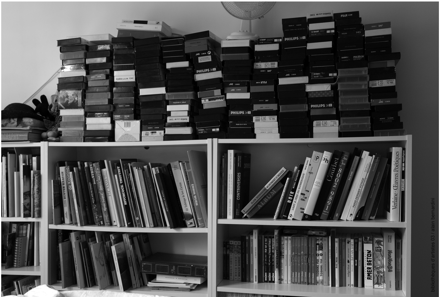
bibliothŕques d'artistes 03 / alain bernardini